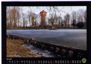
Hilfswerk Lions Club Wolfenbüttel e.V.

Bücher Behr, Kornmarkt 4/5, 38300 WF Buchhandlung Steuber, Am Alten Tore 5, 38300 WF Schloss Museum, Schlossplatz 13, 38304 WF Tourist-Information, Stadtmarkt 7A, 38300 WF WF-Zeitung, Krumbuden 9, 38300 WF