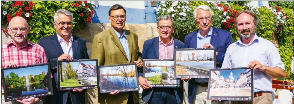
Der neue Kalender vom Lions Club Wolfenbüttel mit dem Thema „Die Oker in und um Wolfenbüttel“.