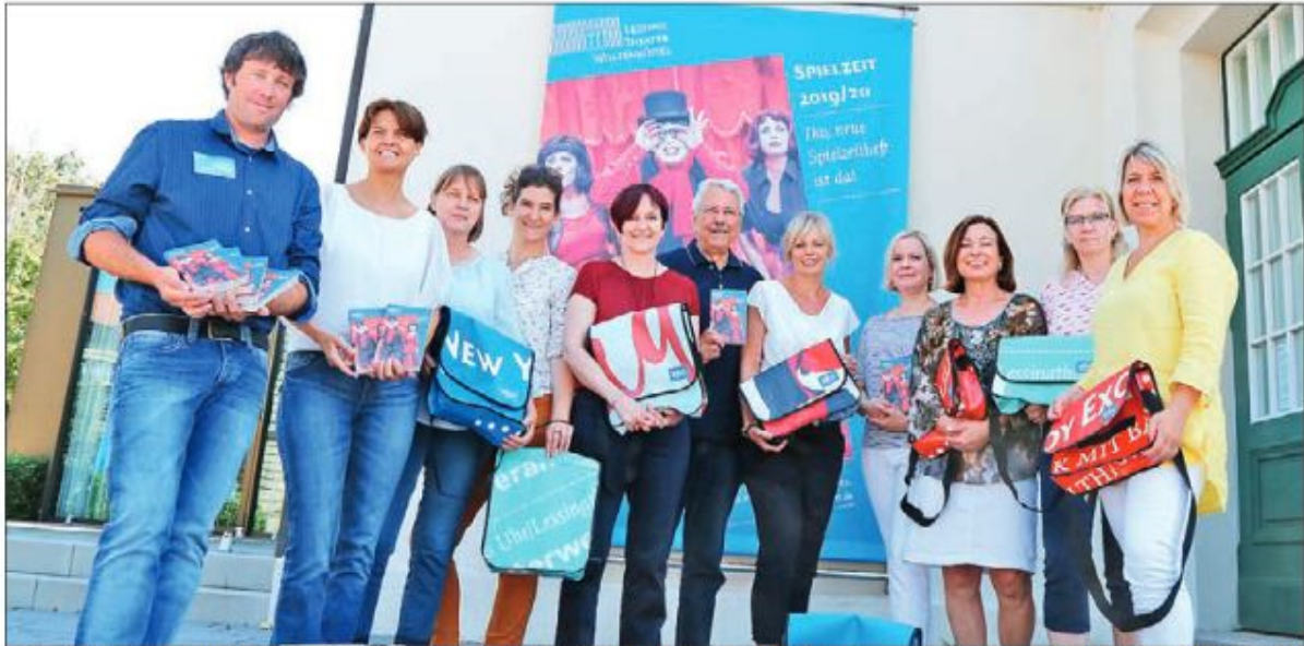
Sie alle präsentierten stolz das neue druckfrische Spielzeitheft vor dem Lessingtheater.