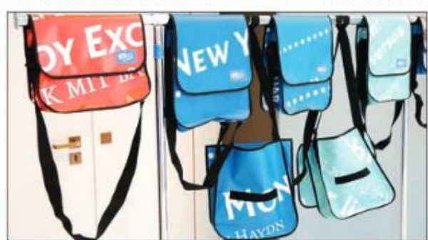
Diese schicken Taschen, „ComeBag“, gibt es zu kaufen.

kommen aus Wolfenbüttel (51,3 Prozent). Mit dem breit gefächerten Programm, das manchmal auch die Sehgewohnheiten des Publikums herausfordere, aber auch bekannte