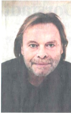
Volker Lechtenbrink ist am 30. September mit Shakespeares „Was ihr wollt“ im Theater zu sehen.