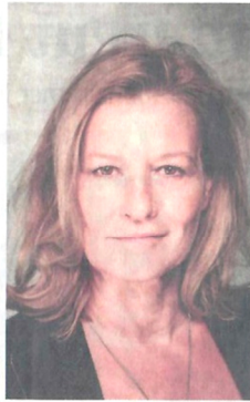
Suzanne von Borsody liest Frida Kahlo heißt es am 21. Februar im Lessingtheater.